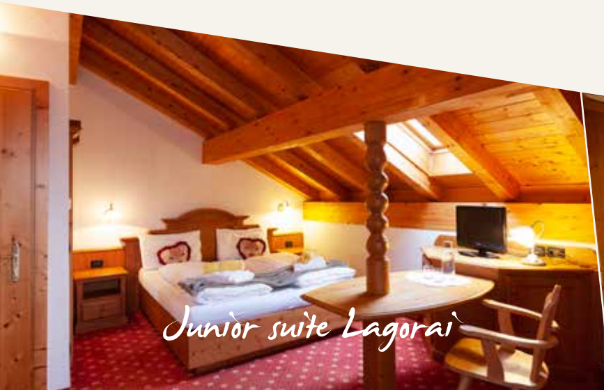
Junior suite Lagorai

fügt über einen einzigartigen Blick auf dieses typisch idyllische Landschaft; atmen Sie tief ein, genießen Sie die Landschaft – ein echter Tonic... versuchen Sie es!