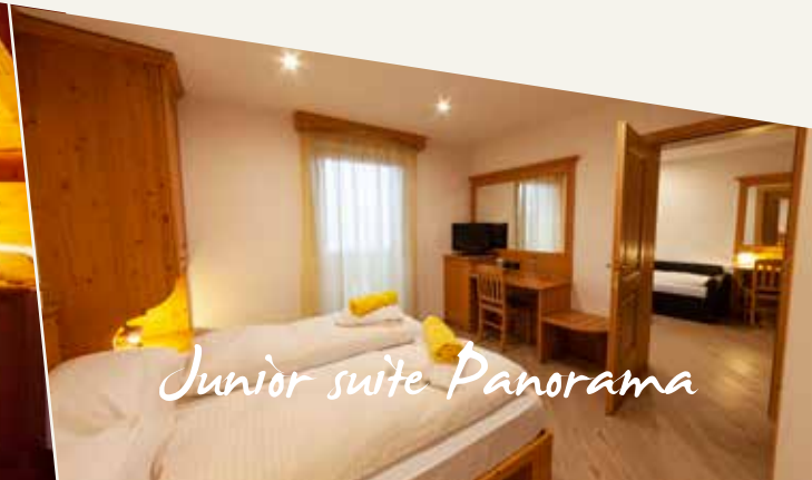
Junior suite Panorama